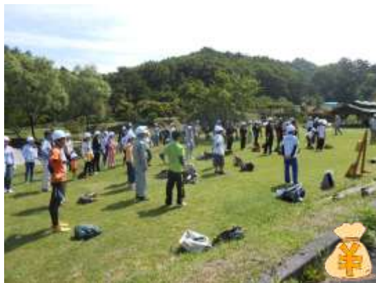
真庭トンボの森づくり