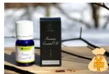
エッセンシャルオイル フローラルウォーター