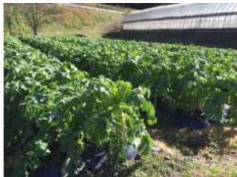
庭先のひるぜん大根